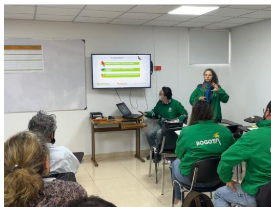
Figura 4. Taller participativo capítulo de prospectiva humedal de Santa María del Lago el día 20/10/2022.