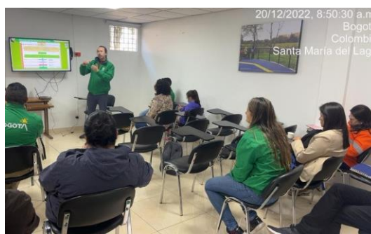
Figura 5. Taller participativo capítulo de plan de acción del humedal de Santa María del Lago el 20/12/2022.