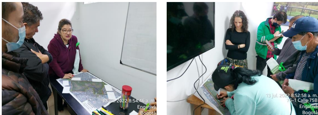
Figura 2. Taller participativo capítulo de descripción el día 13/07/ 2022.