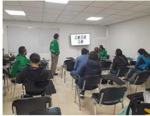
Figura 6. Presentación propuesta actualización zonificación ambiental y plan de acción humedal de Santa María del Lago el 26/04/2023. Fotografías de Marxia Motta, SPPA - SDA, 2023.

Los aportes, propuestas, percepciones y solicitudes presentadas por la ciudadanía y organizaciones comunitarias que participaron en el proceso de actualización del PMA, fueron incorporadas en el instrumento; por lo cual, desde la SDA se hace un reconocimiento a la gestión y acciones desarrolladas por la ciudadanía en la conservación del humedal de Santa María del Lago y agradece su participación en esta actualización.