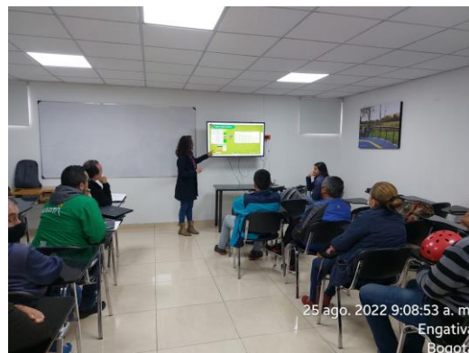
Figura 3. Taller participativo capítulo de evaluación humedal de Santa María del Lago 25/08/2022. Fotografías de María Alejandra Piedra, SPPA - SDA, 2022.