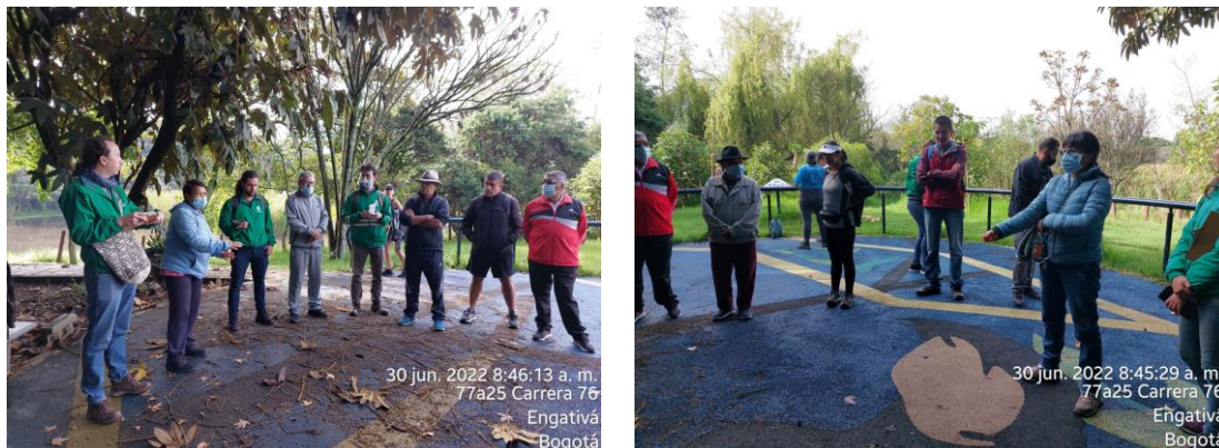
Figura 1. Visita participativa con la comunidad del humedal de Santa María del Lago el día 30/07/2022.

Finalmente, se presentó a la comunidad el 26 de abril de 2023 los resultados de zonificación y plan de acción, donde se compartió la proyección de estrategias, programas, proyectos y actividades para su implementación en los próximos 10 años. A continuación, en las Figuras 1 a la 6, se presenta el registro fotográfico de las actividades realizadas en el marco de la actualización del PMA del humedal de Santa María del Lago: